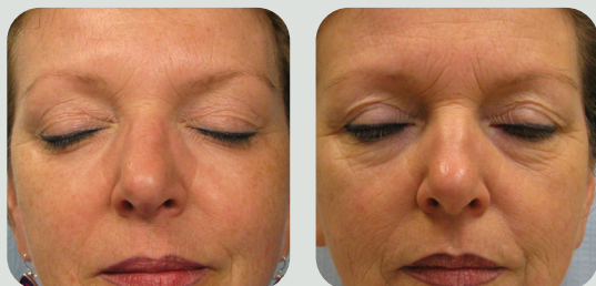
אחרי 4 טיפולים