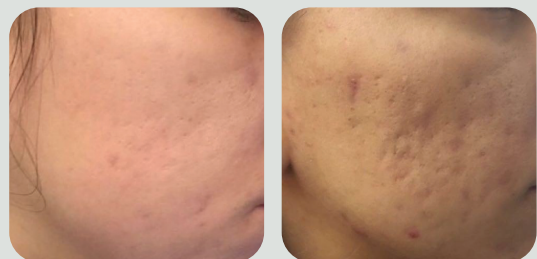
אחרי 5 טיפולים