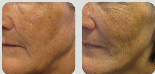
אחרי 4 טיפולים