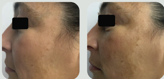
אחרי 2 טיפולים